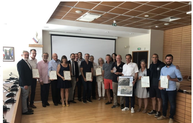
Remise des certifications Ports Propres lors du 5 e Comité de la Charte à Cavalaire