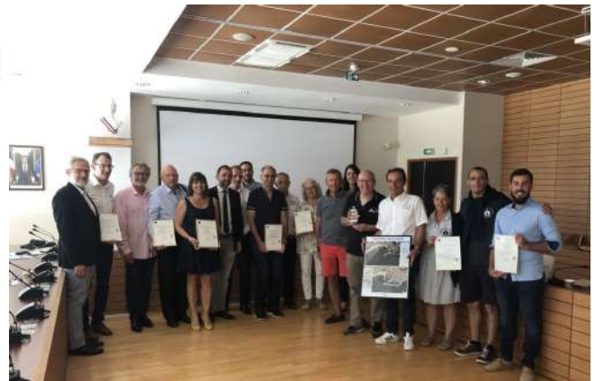
Remise des certifications Ports Propres lors du 5 e Comité de la Charte à Cavalaire