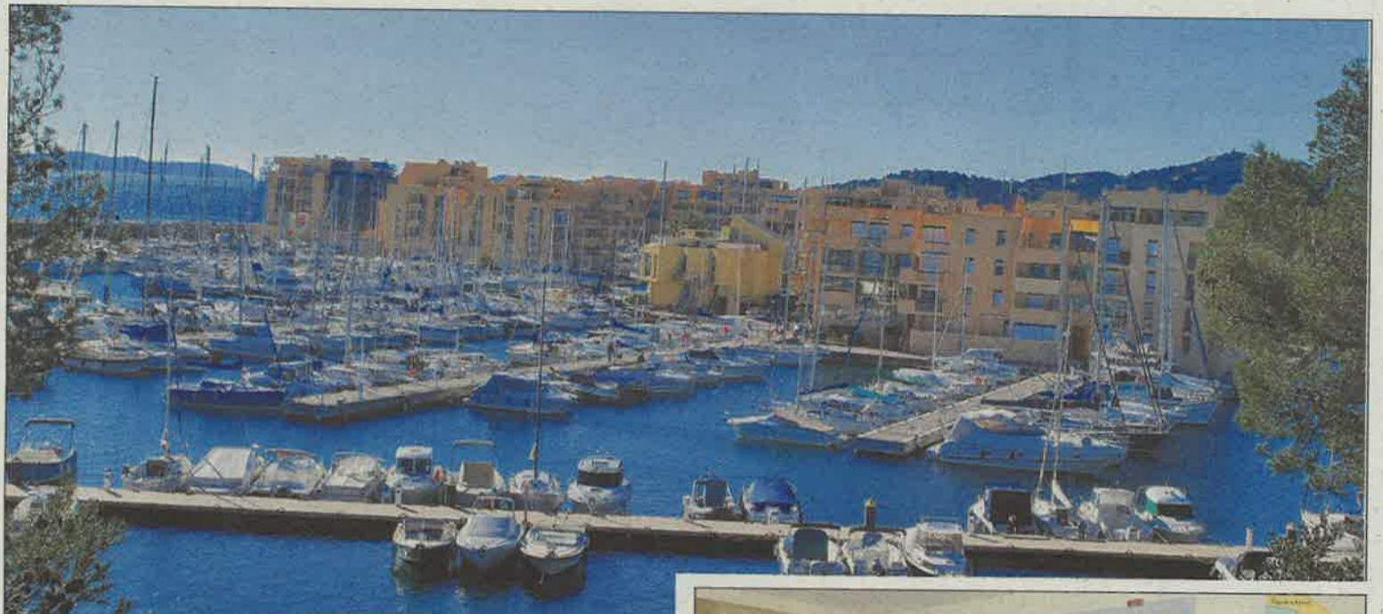
Bormes, premier port d'Europe certifié « port actif en biodiversité. »

En 2017, la Région et l'Union des ports ont souhaité ajouter un volet environnemental sur la biodiversité à la certification port propre. La biodiversité c'est notamment tout ce qu'il y a dans l'eau, ça peut être aérien et terrestre. On s'est dit qu'on avait un peu d'avance sur les autres, puisque nous avons des nurseries pour juvéniles de type reFish. Le conseil d'administration et le président nous ont encouragés à