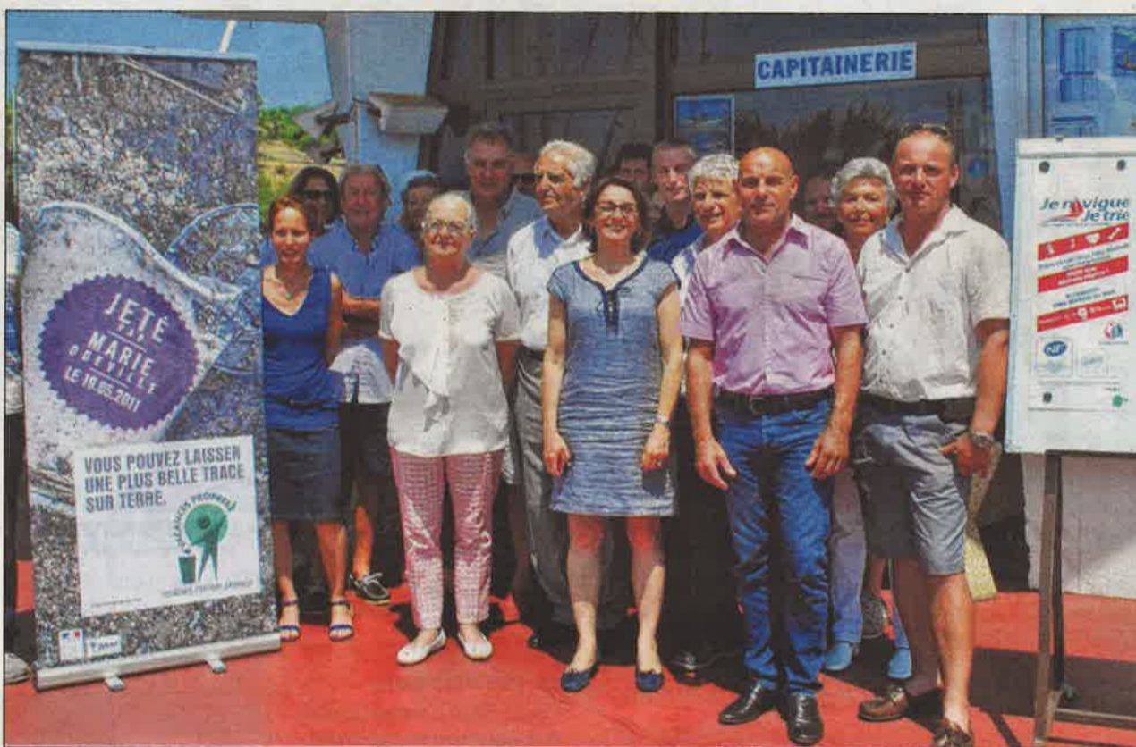
Personnalités et invités, tous mobilisés pour sensibiliser les plaisanciers et les vacanciers au tri des déchets